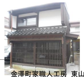
金澤町家職人工房 東山