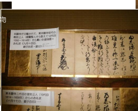
東本願寺二代目の寛如上人(13代目 1614~1658年)からの礼状 (十月十七日、観子百目)