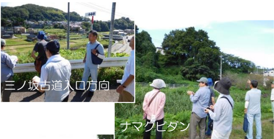
三ノ坂古道入口方向