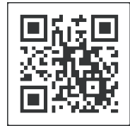
[Petunjuk Vaksinasi COVID-19] Kode dua dimensi