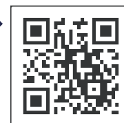
"Corona Vaccine Navi" QR CODE

เว็บไซต์ "Corona Vaccine Navi" : https://v-sys.mhlw.go.jp