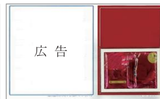
（シャンプー・香水など）