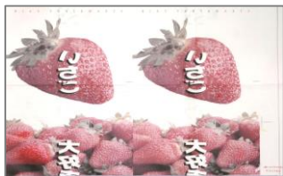
（使用済み昇華転写紙）