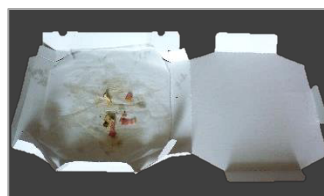
（食品残渣が付着した紙）