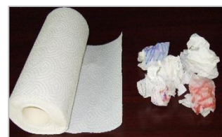
（使用済みペーパータオル）