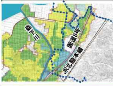
森下川浸水想定区域