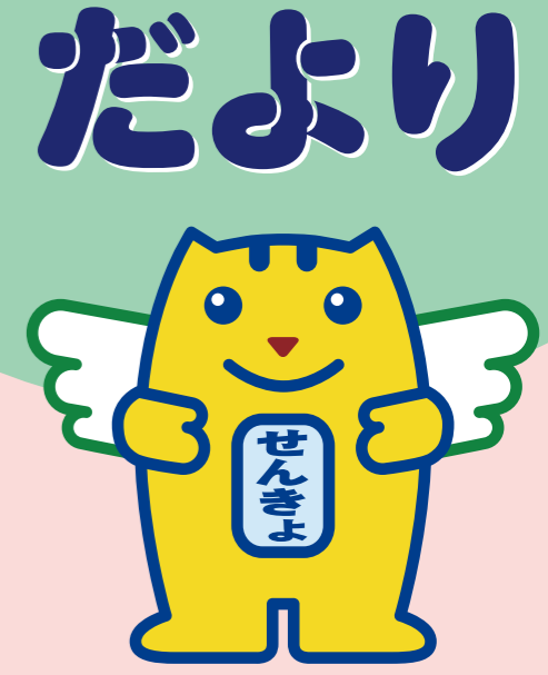
選挙のめいすいくん

有権者が主権者としての自覚 を持って進んで投票に参加し、 選挙が公明かつ適正に行われ、 私たちの意思が正しく政治 に反映される選挙のことです。