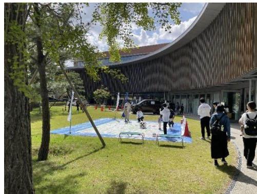
かなざわエコフェスタ 2023の様子