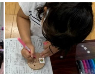
金沢産スギを使った ネームプレート作り