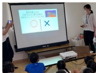
環境に関する ○×クイズ