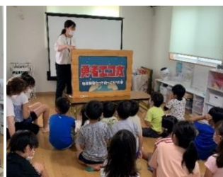
地球温暖化に ついての紙芝居