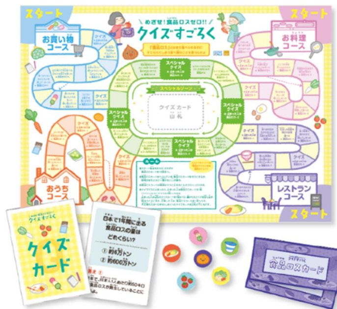
愛知県 クイズすごろく