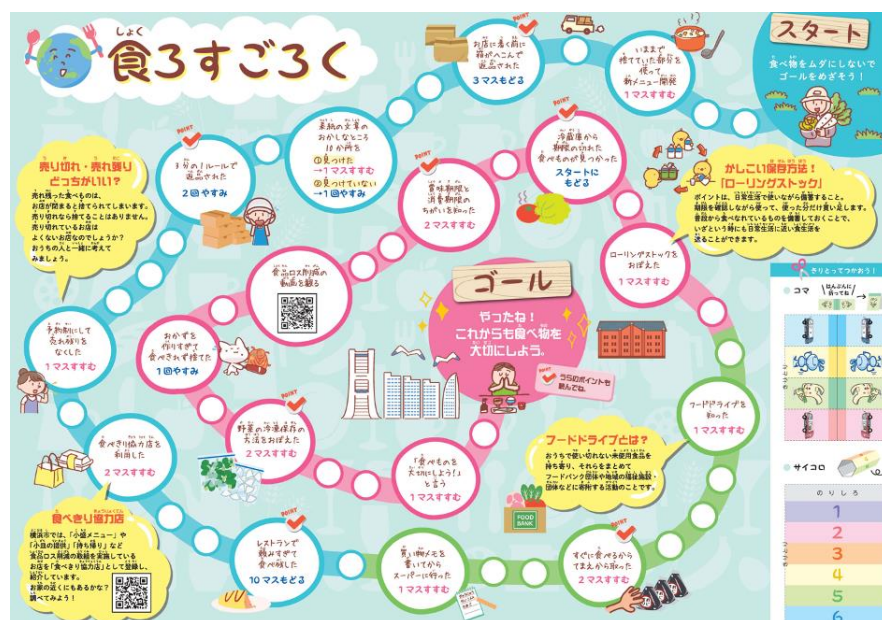
横浜市 食ろすごろく

今年度の金沢工業大学プロジェクトデザインにおいて、学生より提案された企画を具現化し、若年者や子どもが楽しく食品ロス削減を学べる教材を制作、出前講座等で活用する。また、制作したデータは市のホームページに掲載し、プリントアウトすれば誰でも使用できるものとする。