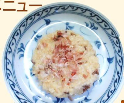
アルファ化米おやき