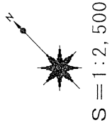
別 図 2