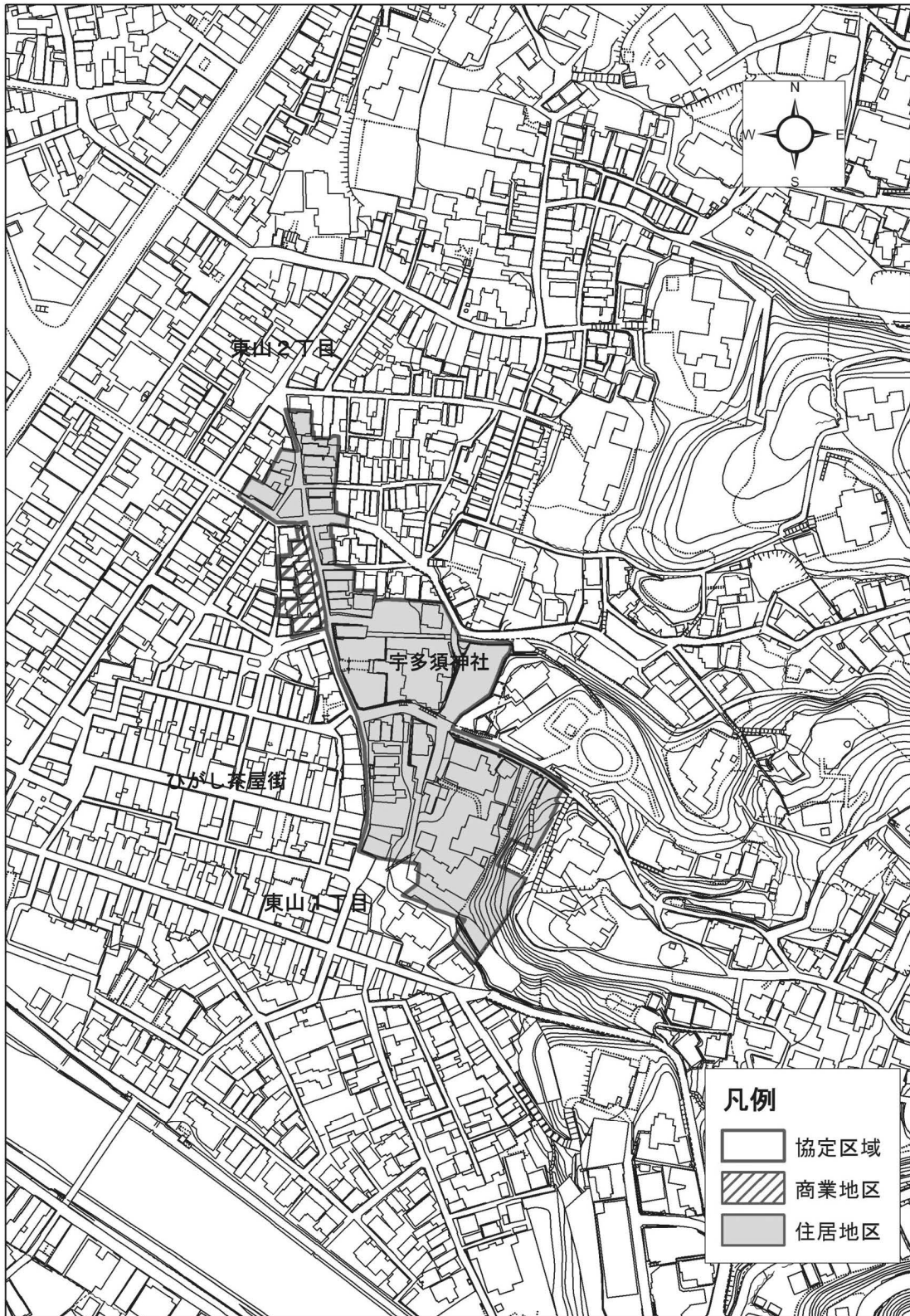
八幡町親交会地区まちづくり協定区域図

(9) 地域において実施される地域活動、地区保存活動等に積極的に参加及び協力をし、良好な近隣関係の醸成に努める。