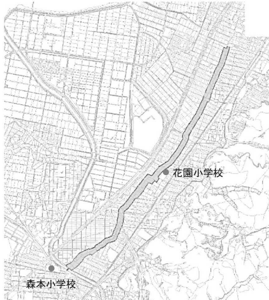
旧北国街道森本・花園区域