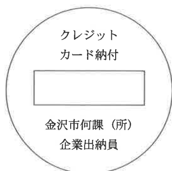
丸型ゴム印日付回転式 径2.5cm

第28条第1項中「第19条」の次に「、第19条の3」を加え、「又は払い出しする」を「、又は払い出す」に改める。