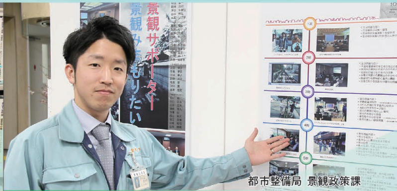
都市整備局 景観政策課