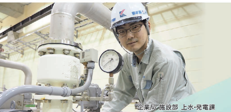
企業局 施設部 上水・発電課

建築分野の中でも、私のように景観政策に関する業務や、建物の審査や検査、建築工事、施設の維持管理など、様々な業務が存在し、より多くの知識と経験を得ることができると思います。