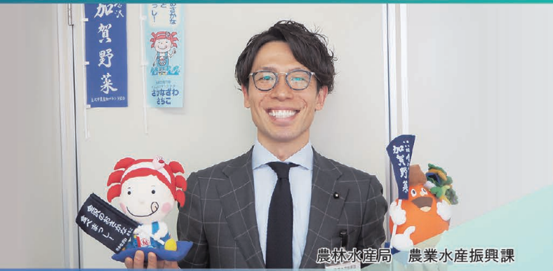
農林水産局 農業水産振興課