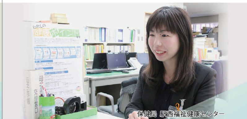
保健局 駅西福祉健康センター