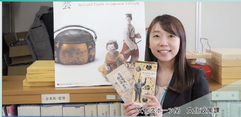
文化スポーツ局 文化政策課