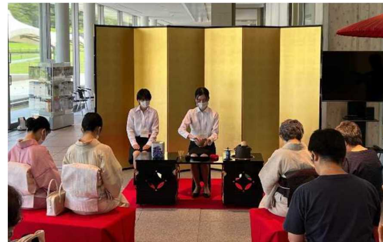
[全国学生大茶会開催]