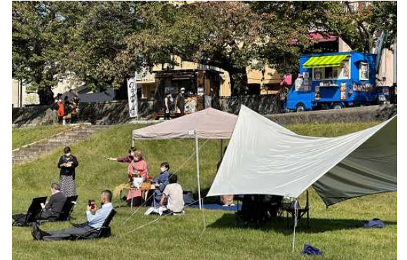
[広場等公共空間活用促進事業]