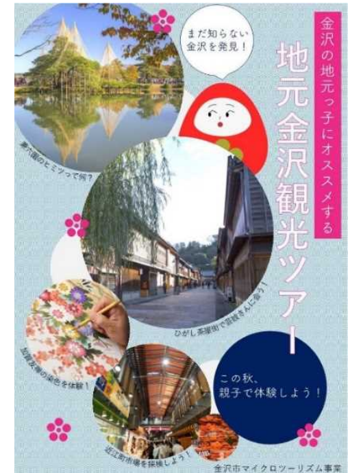
[金沢マイクロツーリズム推進事業]