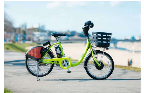
[公共シェアサイクル「まちなか」]