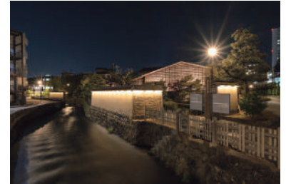
長町武家屋敷群界限