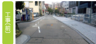
せせらぎ通りにおける工事前後の様子