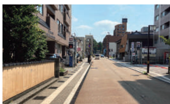
街並みに応じた舗装材や誘導ブロックの色彩・素材選びを推進