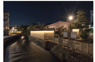
長町武家屋敷群界限