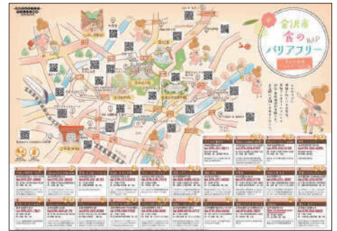
金沢市 食のバリアフリーマップ