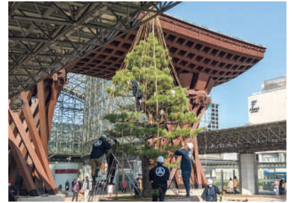
金沢駅前での雪吊り作業

金沢の冬の風物詩「雪吊り」は、北陸地方特有の重い湿った雪から樹木を守るために施されています。金沢の冬の風情が感じられる「雪吊り」は、毎年11月1日兼六園の「唐崎松」から始まり、12月中旬頃まで金沢の至る所で職人さんによる「雪吊り」作業が見られます。