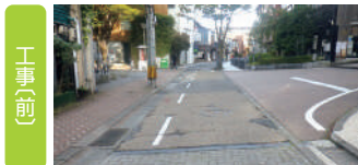
せせらぎ通りにおける工事前の様子