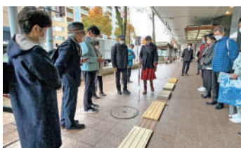
指針を検討するワークショップの様子

令和4年度に「金沢らしいみちすじ修景指針」を策定し、市民・行政の双方に啓発を行うことで、ユニバーサルデザイン※への配慮と景観を両立した経済的かつ効果的な、道路の整備・更新を推進しています。