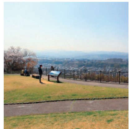
眺望点の案内サイン