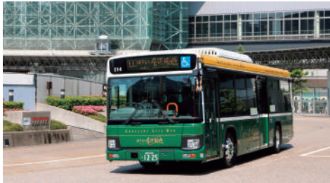
令和4年10月17日から城下まち金沢周遊バス(7台)に導入