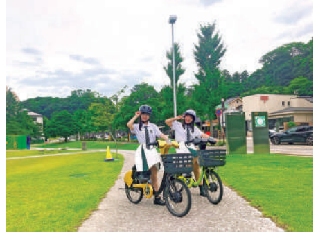
利用者数(人) 目標の年間10万人を大幅に超えて、観光客・市民を問わず多くの方にご利用いただいています。