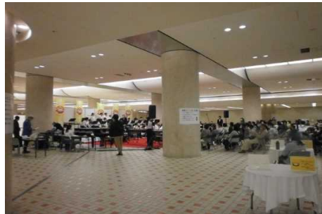
楽都音楽祭ミニコンサート(金沢駅東もてなしドーム地下広場)