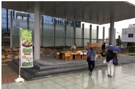
ゆうぐれ金曜マルシェ(金沢駅西イベント広場)