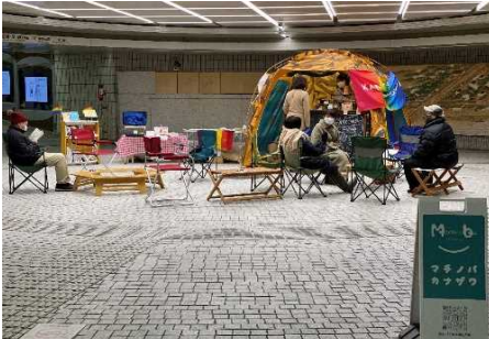
マチノバ・カナザワ(香林坊バセオ)