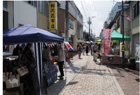
しんたてふれ愛まつり(新堅町商店街)