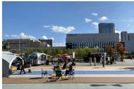
マチノバ・カナザワ(金沢駅西イベント広場)