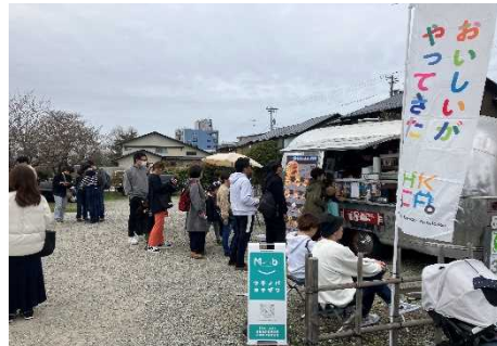
マチノバ・カナザワ(桜橋詰河岸緑地)