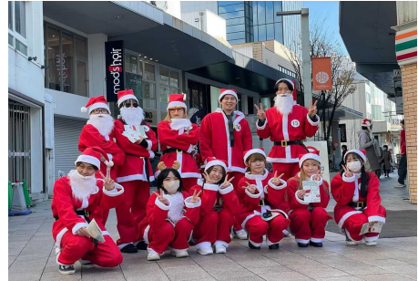
マチノバ・カナザワ(タテマチストリート)