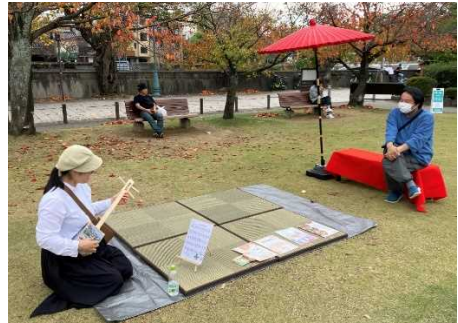
マチノバ・カナザワ(東山河岸緑地)