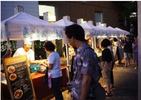
美酒 de Marche(香林坊にぎわい広場)