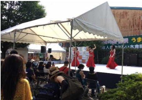
ふうりんまつり(木倉町広場)