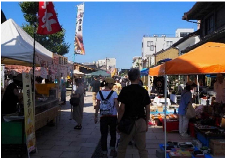
よこっちょ・ポッケまーと(金澤表参道)