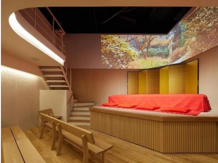
出典元：鶴めいホール (URL: https://www.kakumei-hall.com/ )