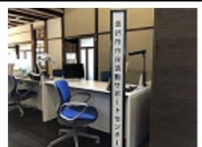
市民活動サポートセンター窓口