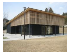
三谷さとやま交流広場