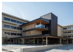
金沢未来のまち創造館