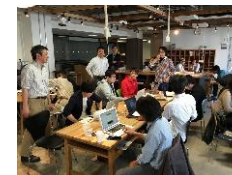
ITビジネスプラザ武蔵