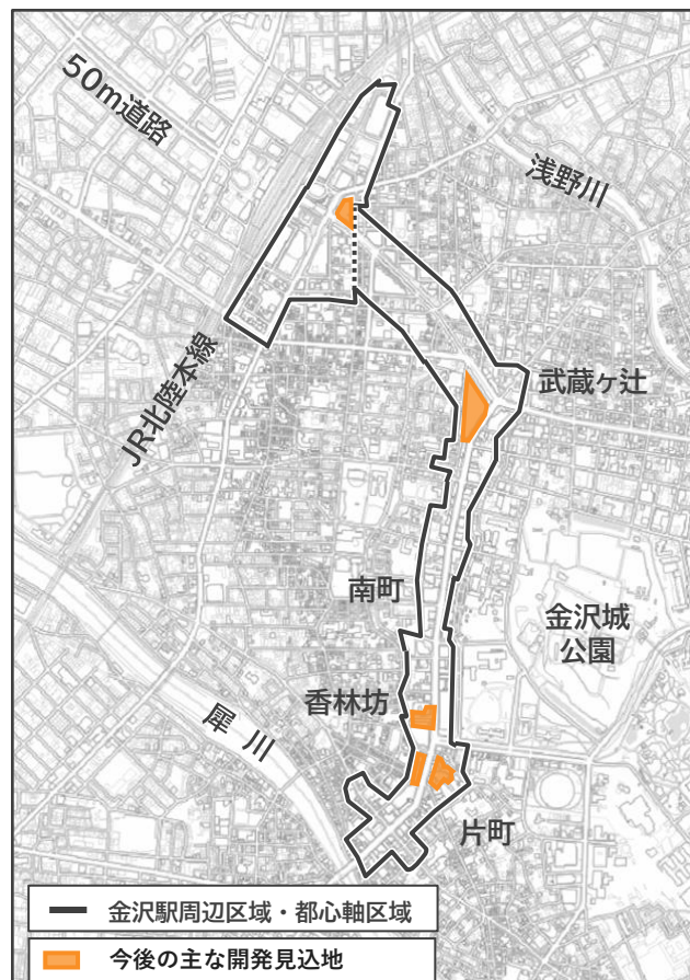
今後の主な開発見込地