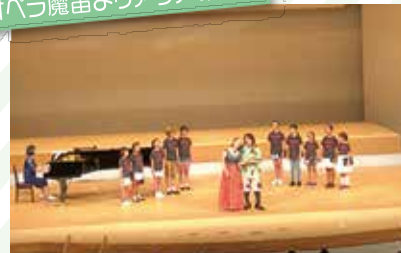
石川県音楽文化協会