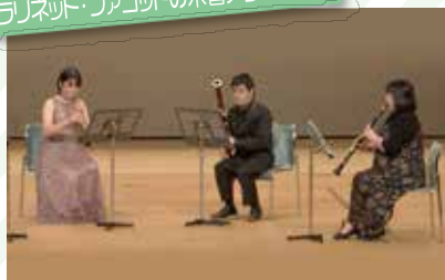
金沢市音楽文化協会