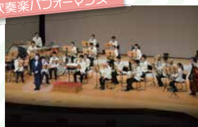
金沢市立工業高等学校吹奏楽部