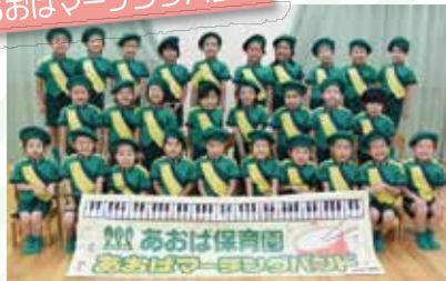
あおばマーチングバンド (幼保連携型認定こども園あおば保育園【小松市】)