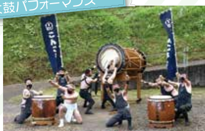
辰巳こんころ太鼓保存会(石川県太鼓連盟) 金沢百萬石太鼓(石川県太鼓連盟)