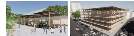
最優秀賞(学生団体 SNOU) 優秀賞(うちけん A)

「木を取り入れた公共デザイン」をテーマに募集した各提案のうち最優秀賞と優秀賞を受賞した作品を展示します。