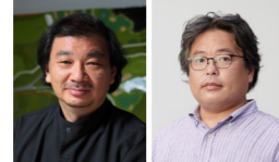
建築家 坂茂 建築史・建築批評家 五十嵐太郎

開催日: 11/16(水) 19:00~21:00 会場: 金沢市文化ホール 大ホール 定員: 750名(参加無料)・要予約/定員に達し次第受付終了 お問合せ先: (株)オトムラ「金沢・建築文化会議」係 TEL:076-268-3737 FAX:076-268-0212 mail:kenchiku@otomura.co.jp