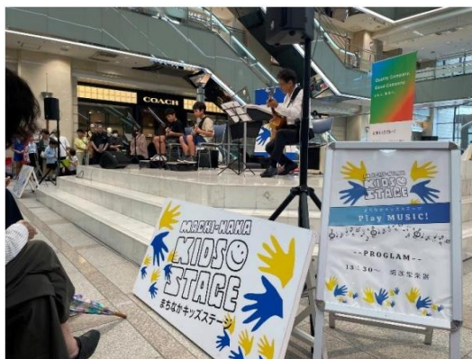
(まちなかパフォーマンスシアター)