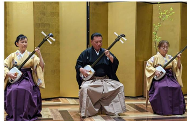
(芸術文化ナイトシアター)