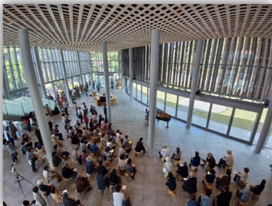
(ランチタイムコンサート)

ランチタイムコンサート(市役所第2本庁舎)、まちなかパフォーマンスシアター、芸術文化ナイトシアター(金沢中央観光案内所)などが、 日常的に開催 され、 手軽に検索・観覧 できる仕組み