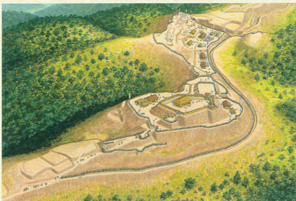
▲切山城跡復元イラスト 原画作成：香川元太郎 監修：千田嘉博

ことから、越中の佐々方の攻撃に備えた前田方の城である可能性が高く、逆に松根城跡は加賀側に大きな堀が認められることから、佐々方の城と考えられ、小原越を通じて対峙している。