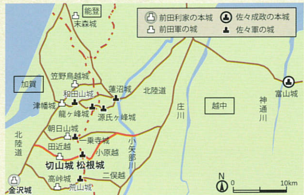
▲加越国境城跡群及び道の位置(天正12年頃)

両城跡の年代は、城の形や出土遺物、古文書などで、天正12・13年にほぼ限られることから、織田・豊臣の武将が築造した城郭の発展過程が把握できる希有な事例となり、近世城郭の成立過程を知る上での標識遺跡になると評価されている。