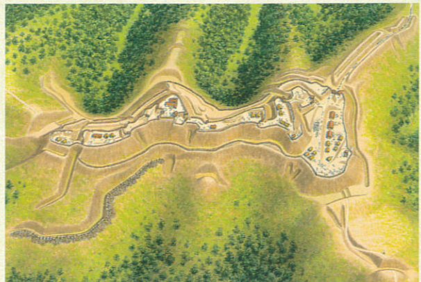
▲松根城跡復元イラスト 原画作成：香川元太郎 監修：千田嘉博