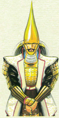
▲前田利家 原画作成：宮下英樹

加賀と越中の国境を舞台に繰り広げられた前田利家と佐々成政の争いの痕跡を現在に伝える「加越国境城跡群及び道」は、平成27年10月に国史跡に指定された。この史跡は、城と道を一体的に価値付けして指定された日本で最初の事例であり、極めて貴重な歴史資産であると評価されている。