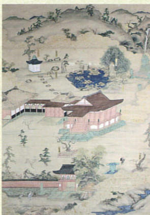
▲「本泉寺境内之図」

織田信長と大坂本願寺による石山合戦は天正8年(1580)に和睦によって終戦するが、加賀