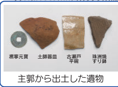
主郭から出土した遺物