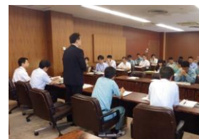
第 2 回 歴史都市推進プロジェクト