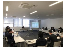
第1回 歴史まちづくり協議会