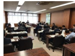
第1回 歴史まちづくり協議会

主な意見：歴史的風致形成建造物については今後、用水や 庭など幅広く指定してほしい