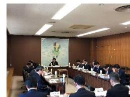
第1回 歴史まちづくり協議会