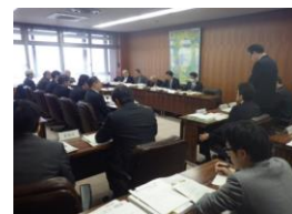
第 2 回 歴史まちづくり協議会