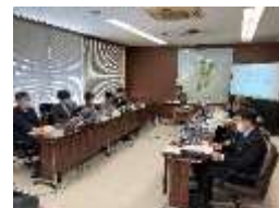
第1回 歴史まちづくり協議会