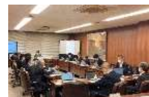
第1回 歴史まちづくり協議会