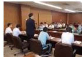
第 2 回 歴史都市推進プロジェクト