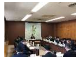
第1回 歴史まちづくり協議会