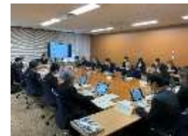
第1回 歴史まちづくり協議会