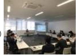
第1回 歴史まちづくり協議会