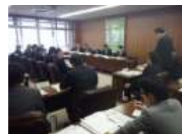
第 2 回 歴史まちづくり協議会