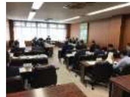
第1回 歴史まちづくり協議会

主な意見：歴史的風致形成建造物については今後、用水や 庭など幅広く指定してほしい