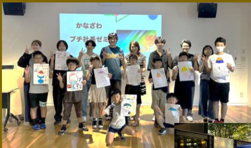
第1回「かなざわプチ社長ゼミ」の様子