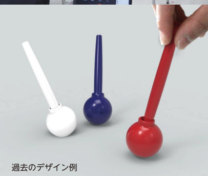
過去のデザイン例