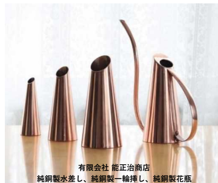
有限会社 能正治商店 純銅製水差し、純銅製一輪挿し、純銅製花瓶