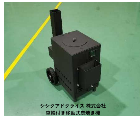
シシクアドクライス 株式会社 車輪付き移動式炭焼き機