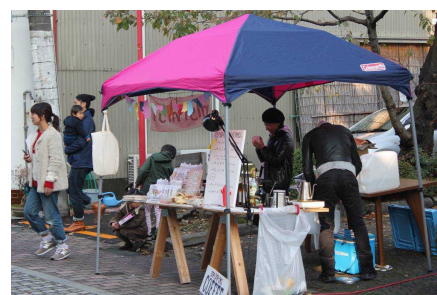
屋外カフェも人気