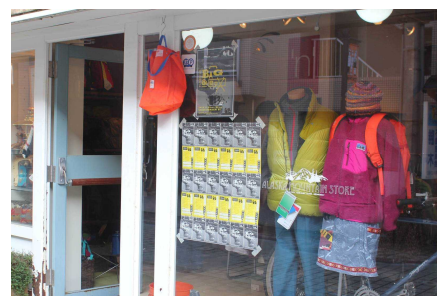
イベントのチラシが貼られた店舗

販売のほかに、オリジナルバッグや箱型のペン立てを作るワークショップも開催され、参加者は思い思いに制作を楽しんでいました。また、イベント期間中限定で屋外カフェもオープン。多くの家族連れや若者が訪れ、イベントに彩りと憩いを提供していました。