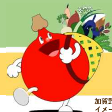
加賀野菜 イメージキャラクター ベジタン