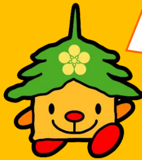
金沢産材マスコットキャラクター かなりん

親子で夏休みの 思い出づくり♪ かなざわの木を つかって、DIYを やってみませんか？