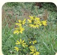
オオハンゴンソウ※