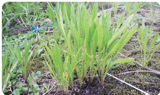
8月に2回目の刈り取り

6・8月の2回刈り取りを数年間行うことにより、ほとんどのオオキンケイギクを駆除することができます。