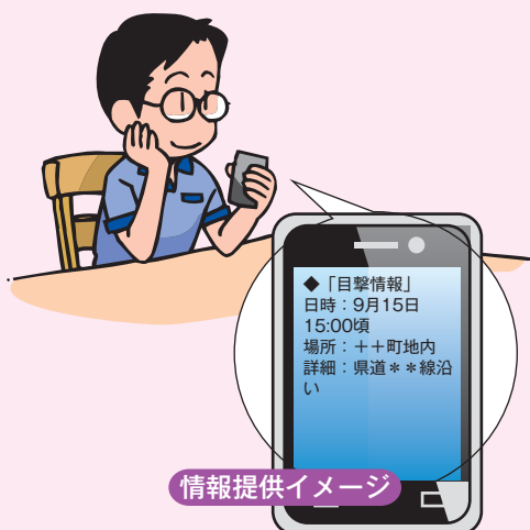
情報提供イメージ

登録した校下・地区のクマ出没情報を配信しますので、必要な校下・地区を登録してください