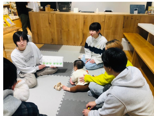
絵本読み聞かせ会