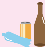
屋外に放置された空きビン・缶・ペットボトル