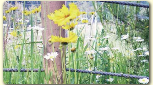
6月に1回目の刈り取り

6・8月の2回刈り取りを数年間行うことにより、ほとんどのオオキンケイギクを駆除することができます。