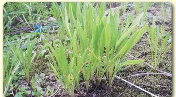
8月に2回目の刈り取り