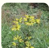
オオハンゴンソウ※①