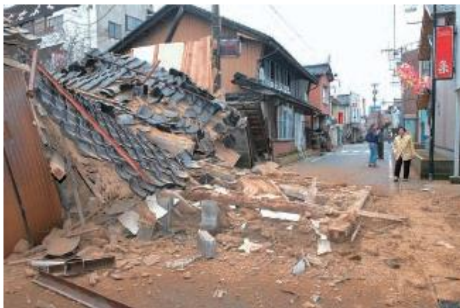
平成 19 年 能登半島地震による被害