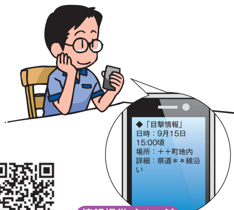
情報提供イメージ