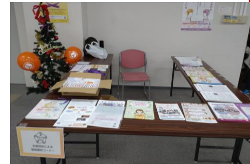
支援団体紹介コーナー