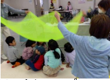
支援団体によるワークショップ