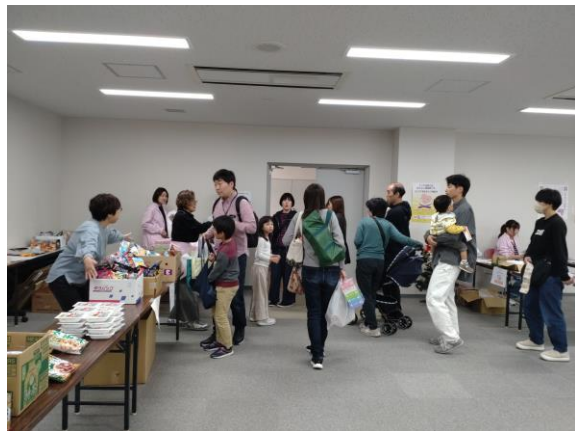
企業や個人の寄付による食材配布