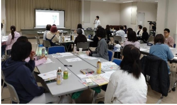
支援団体・企業のランチ交流会