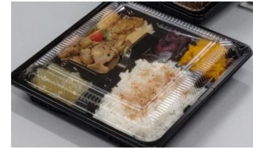
こども食堂スマイリーキッチンごはんさんのお弁当

NPO法人あかりプロジェクト、あそび場ひだまり、 アダルトチルドレンAC自助グループ「いやしは〜と」 石川に心理カウンセリングを定着させる会（CCIプラス） ウェルビーイングライフサポート金沢、円光寺こども食堂 金沢市子育て避難所おりがみ、CAPいしかわ NPO法人シンママ応援団、スマイリーキッチンごはん ねこじゃらしの会、発達障害保護者会よりみち ぽこあぽこ、ヤングケアラープロジェクトいしかわ、 アルビス株式会社、株式会社バローホールディングス、 セブンイレブン徳光ハイウェイオアシス店 ご協力ありがとうございました。