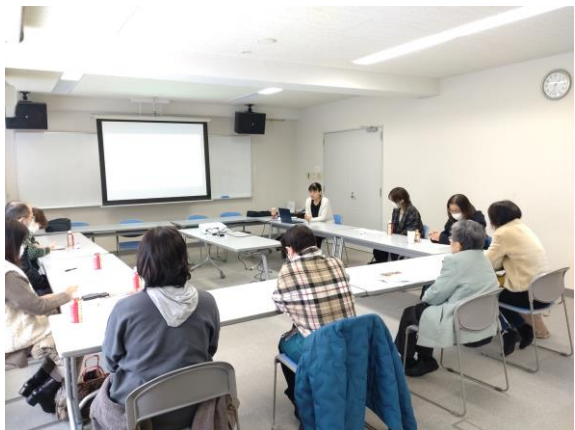
こどもを支える人たちの学習会