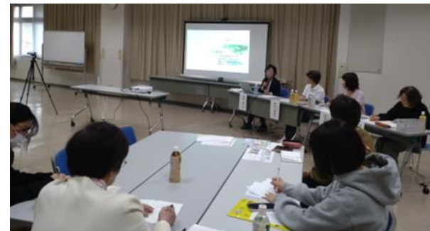
専門家×支援団体×子育て支援課のトークイベント