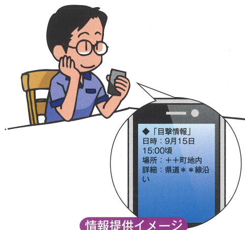
情報提供イメージ

注3) @kanazawa-bousai.com からのメール、または mail@kanazawa-bousai.com を受信できるように設定してください。