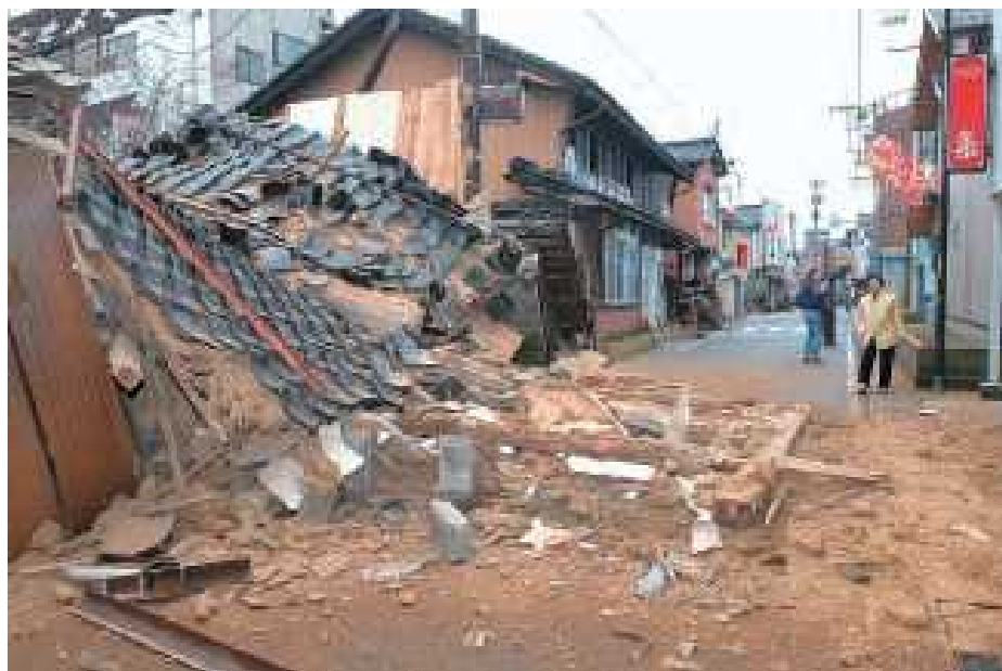
平成 19 年 能登半島地震による被害