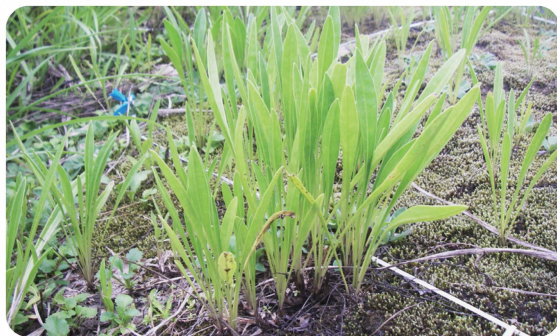
8月に2回目の刈り取り

6・8月の2回刈り取りを数年間行うことにより、ほとんどのオオキンケイギクを駆除することができます。