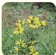
オオハンゴンソウ※