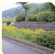
オオキンケイギク