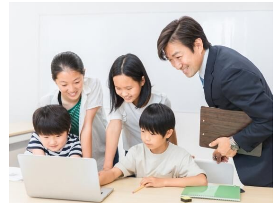
継続的に実施する プログラミング講座