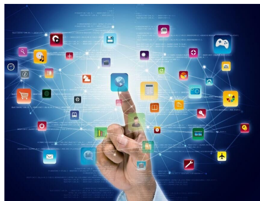
小学生向け・ 2日間開催型講座