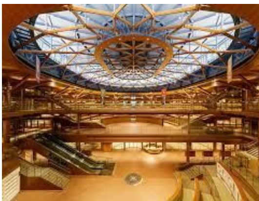
石川県立図書館での 出張講座