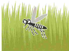
風通しの悪いやぶ・草むら