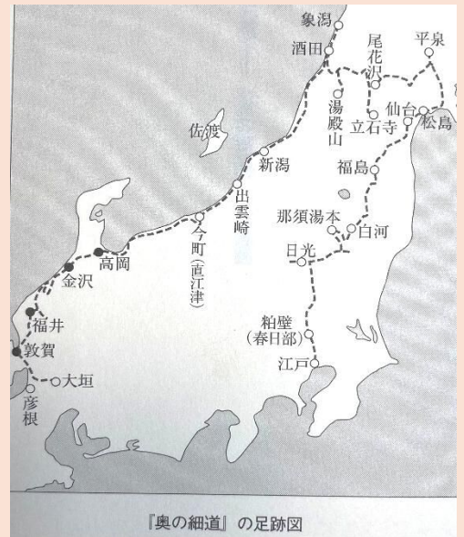
「奥の細道」の足跡図

松尾芭蕉(46歳)1689(元禄2)年3月27日、門人河合 曾良(41歳)と共に江戸を出発