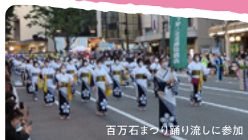
百万石まつり踊り流しに参加

当会の会員は年齢層が高いので、ほとんどの方がワクチンの3回～4回の接種を受けていますが、今後、さらなる接種や感染対策を呼び掛けながら、通常の事業展開ができるようにしていきたいと思っています。