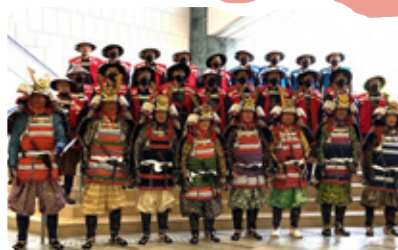
百万石行列に参加