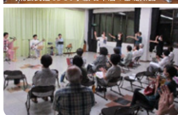
湯涌公民館 お届けアーツ邦楽コンサート