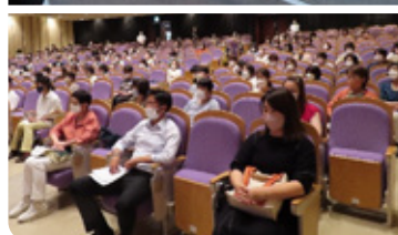
市長と語る会を開催

協働をすすめる市民会議は、平成18年に設置した「自主的かつ自発的な市民参加及び協働による市政を推進するための組織」です。第9期の委員は17名。地域団体の役員や市民活動団体の代表、学識経験者のほか、公募委員の皆さんで構成されています。今回は、新たに委員になられた方の活動などについてご紹介いたします。