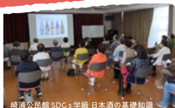
崎浦公民館 SDGs 学級 日本酒の基礎知識